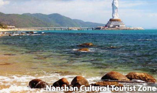
Nanshan Cultural Tourist Zone

種玫瑰花，以“玫瑰之約，浪漫三亞”為主題，五彩繽紛的玫瑰花為載體，集玫瑰種植、文化展示、旅遊休閒度假於一體。【解放路步行街】三亞市內第一條商業步行街，也是三亞文化的象徵之一。銀器店。餐:B/L/D