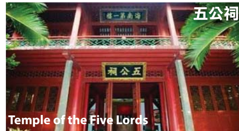
Temple of the Five Lords